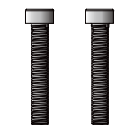
キャップボルト M6×35mm 2本