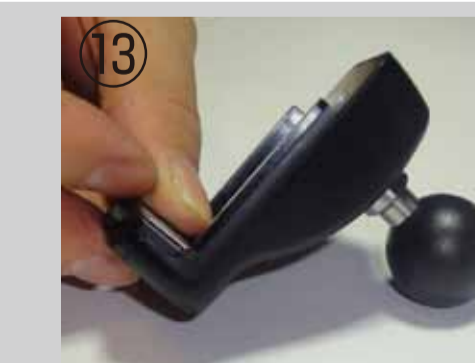
マウントシステム取り付け完成

写真⑫の様に、マウントパーツを取り付けます。※スパナを使用してしっかりと締めてください。