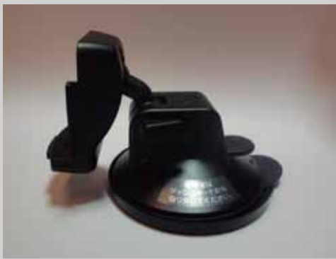
ゴリラ純正カーマウント