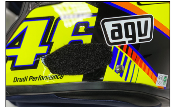
ベース用面ファスナーを貼り付けた場合