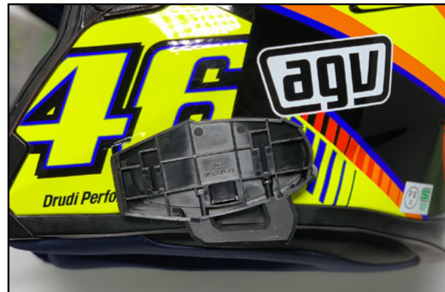
ワイヤークリップタイプのベースプレートを取り付けた場合