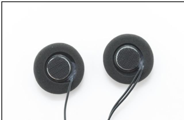
スピーカー裏面へベルクロフック (硬い方) を貼り付ける。